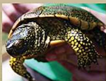
Tortuga d'aigua europea