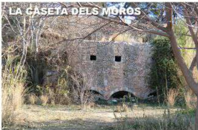
LA CASETA DELS MOROS

Ubicada aigües avall del Castell d'Almassora. El 1519 Castelló i Almassora decideixen construir el primer assut comunitari i encarreguen les obres al mestre pedrapiquer Pere de la Carrera. Les obres, acabades l'any 1525, van ser destruïdes per una forta riuada el 1531 malgrat la seua solidesa. Al costat de la presa, es va edificar una alqueria que donava entrada a les aigües per mitjà de tres arcs de pedra, és la que coneixem popularment amb el nom de la Caseta dels Moros, encara que no van tindre res a veure els moros en la seua construcció.