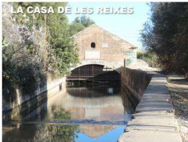
LA CASA DE LES REIXES

Després de la desfeta del primer assut, el 1549 es projecta la construcció d'un nou assut comunitari més amunt del Castell, prop d'on s'ajunten les aigües del Millars i la Rambla, però també va ser arrossegat per les aigües l'any 1560. El 1618 els dos pobles decideixen canviar la ubicació de l'assut a un lloc més segur per a evitar les fortes riuades però no va ser fins 1895 quan es va construir l'assut que tenim actualment. És obra de l'arquitecte Francesc Tomàs Traver. És un edifici molt sòlid, de pedra tallada, amb elements decoratius com motlures i baranes de ferro. Al seu interior, les comportes regulen l'entrada de les aigües cap a la séquia Minada en direcció a la Casa de les Reixes.