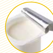
Envasos de plàstic (iogurts, postres, lactis...) Envases plásticos (yogures, postres, lácteos...)