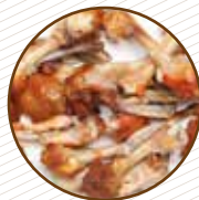
Restes de carn i peix Restos de carne y pescado