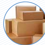
Caixes de cartó esclafades Cajas de cartón aplastadas