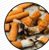
Pols d'agranar i burilles Polvo de barrido y colillas