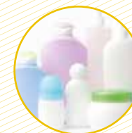
Envasos de productes de neteja, tubs de dentífric i cosmètics Envases productos de limpieza, tubos dentífricos y cosméticos