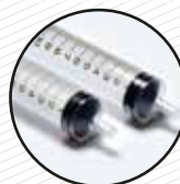
Xeringues d'ús domèstic Jeringuillas de uso doméstico