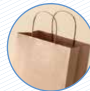
Bosses de paper i paper de regal Bolsas de papel y papel de regalo