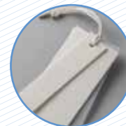
Tiquets i etiquetes Tickets y etiquetas