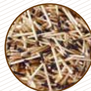
Taps de suro, mistos i furgadents Taponos de corcho, cerillas y palillos