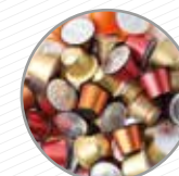
Càpsules de café Cápsulas de café