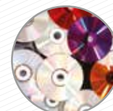
CD, DVD, Blu-ray, cintes de vídeo CD, DVD, Blu-ray, cintas de vídeo