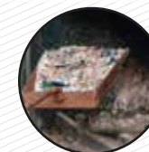
Cendra de cigarrets, ximeneia o estufa Cenizas de cigarrillos, chimenea o estufa