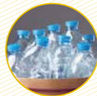
Botelles i pots de plàstic esclafats Botellas y botes de plástico aplastados