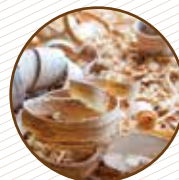
Serradura i excrements d'animals domèstics Serrín y excrementos de animales domésticos