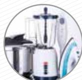
Xicotets electrodomèstics Pequeños electrodomésticos