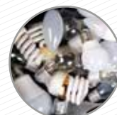
Bombetes led i llums de baix consum Bombillas led y luces de bajo consumo