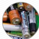
Piles i bateries Pilas y baterías