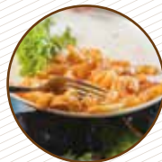
Restes de menjar cuinat i aliments caducats Restos de comida cocinada y alimentos caducados