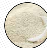
Arena d'animals Arena de animales