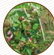
Xicotetes restes de plantes i flors Pequeños restos de plantas y flores