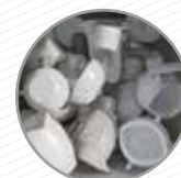
Utensilis de cuina (cristall o pisa) Utensilios de cocina (cristal o cerámica)