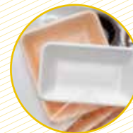
Safates de porexpan Bandejas de porexpan