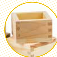
Caixes xicotetes de fusta Cajas de madera pequeñas