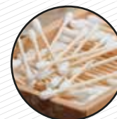
Bastonets, fulles d'afaitar, raspall de dents, llimes, tiretes... Bastoncillos, cuchillas de afeitado, cepillo de dientes, limas, tiritas...