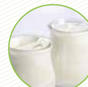
Pots de vidre (iogurts, postres, lactis...) Tarros de vidrio (yogures, postres, lácteos...)