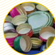
Tapes metàl·liques i taps de plàstic Tapas metálicas y tapones de plástico