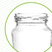
Pots de melmelada i conserves de vidre Botes de mermelada y conservas de vidrio