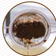
Solatge del café i resta d'infusions Posos del café y resto de infusiones