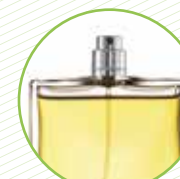
Pots de colònia i cosmètics de vidre Botes de colonia y cosméticos de vidrio