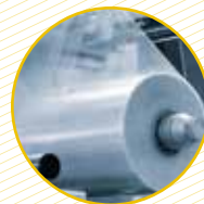
Film plàstic i d'embalatges Plástico film y de embalajes