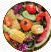
Restes de fruita i verdura (pells, pinyols...) Restos de fruta y verdura (peladuras, huesos...)