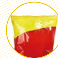
Bosses d'aperitius, llepolies i congelats Bolsas de aperitivos, golosinas y congelados