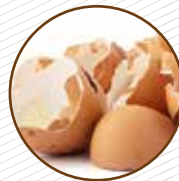
Closques d'ou, marisc i fruits secs Cáscaras de huevo, marisco y frutos secos