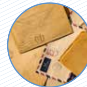
Fulles i sobres Hojas i sobres