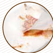
Paper de cuina i tovallons bruts de restes de menjar Papel de cocina y servilletas sucias de restos de comida