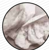
Paper usat amb productes de neteja o químics Papel usado con productos de limpieza o químicos