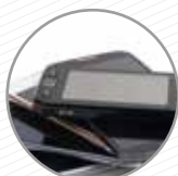
Mòbils i tauletes tàctils Móviles y tablets