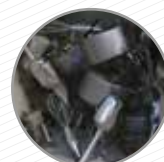
Utensilis de cuina (metall) Utensilios de cocina (metal)