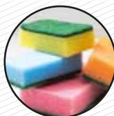
Espart de fregar, baietes... Estropajos, bayetas...