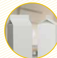
Envasos tipus bric Envases tipo brick