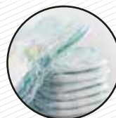
Bolquers, compreses, tovalloletes, gases... Pañales, compresas, toallitas, gasas...