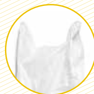
Bosses de plàstic Bolsas de plástico