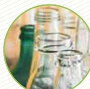
Pots de vidre (suc, llet, oli, alcohol...) Botellas de vidrio (zumo, leche, aceite, alcohol...)