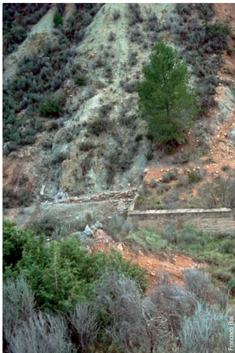
Salinas continentales de Macastre

entidad promotora: Ayuntamiento de Macastre