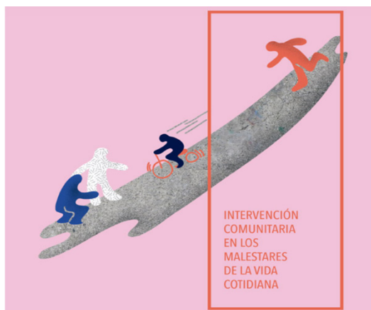
Il·lustració 3: Portada Intervención Comunitaria en los malestares de la vida cotidiana.