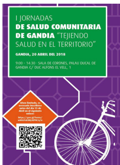
Il·lustració 4: Cartell de les I Jornades de Salut Comunitària impulsades en Gandia.

Precisament per aquest motiu, per assenyalar les diferents possibilitats de les administracions locals en la promoció de la salut a través de diferents àmbits, és un document que cal tenir en compte a l'hora de redactar el Pla de promoció de la salut del municipi de Paiporta. A més, tot ell s'ha fet acompanyat de diferents jornades formatives orientades al personal tècnic municipal i a la ciutadania.