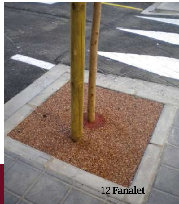
Nuevos alcorques accesibles a nivel.