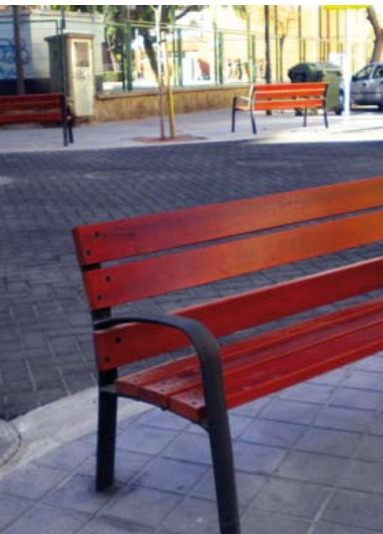
Se han colocado bancos de última generación en los cruces del entorno de Ramón Laporta.

La reforma de Pío XII estaba a punto de culminar al cierre de esta edición. La calle se ha renovado por arriba y por abajo, ya que se ha cambiado la red de aguas potables y saneamiento, y la instalación del alumbrado público. El objetivo era conseguir espacios más acogedores y transitables, por ello, hay aceras más amplias, todos los cruces son accesibles, se han previsto bancos y mobiliario urbano cómodo y moderno, y se plantarán árboles. El proyecto se completa con la construcción de un parque en el