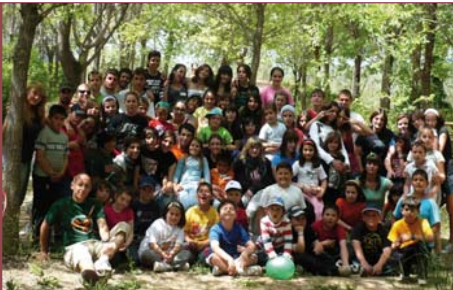
Participants d'Esplais Valencians

A hores d'ara, l'associació compta amb més de 50 monitors i monitores que decideixen dedicar el seu temps lliure a l'educació en valors dels més de 200 xiquets i xiquetes que formen part dels diferents grups d'Esplai.