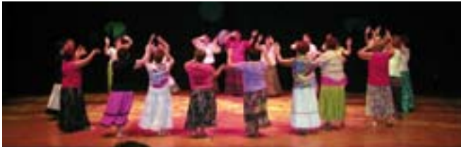
Representación de teatro del Taller de Artes Escénicas.