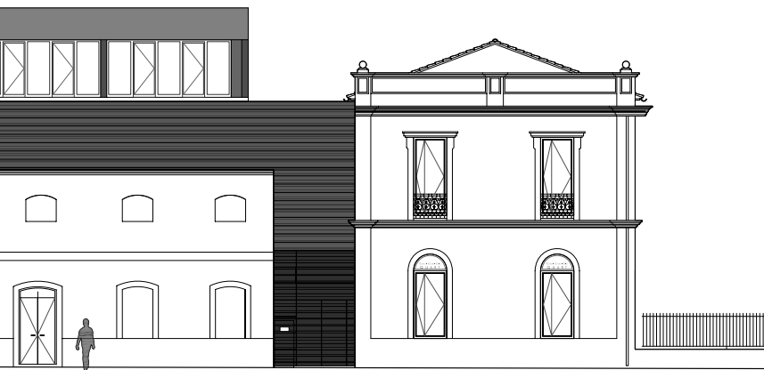
Perfil de la remodelación integral del Complejo Cultural El Casino

El edificio se convierte en un centro de recursos interculturales en red abierto, plural, accesible y dotado de nuevas tecnologías al servicio de la ciudadanía. Albergará locales de la Sociedad de Cazadores, del Club de Ajedrez y del Club de Billar, de la Societat Musical “La Unió”, de la Asociación Cultural y Recreativa “Centro de Convivencia” y de la Associació Musical “L’Amistat”. Habrá también una sala de exposiciones, ludoteca, salas de juegos, sala de lectura, aseos, camerinos y dependencias de administración, entre otros servicios.