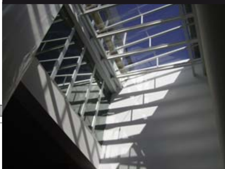
Interior remodelado del Complejo Cultural El Casino.