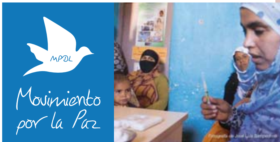
Imatge de l'exposició "Sahara. Pequeñas visiones".

Quart Jove ha acollit l'exposició "Sahara. Pequeñas visiones". L'ONG Moviment per la Pau, el fotògraf José Luis Sampedro i 45 xiquets sahrauís d'entre 10 i 12 anys ens mostren un relat fotogràfic de l'univers sahrauï contat des dels ulls dels seus protagonistes més xicotets. És el dibuix en primera persona de les seues cases, escoles, del seu temps de jocs i del seu transcórrer diari. És el retrat generós d'un grup de xiquets i xiquetes que ens permet aguaritar al significat de tindre per llar i horitzó el desert algerià. És una paleta negada de color, arena i sol. Però és més, és la imatge que, des del seu refugi, llancen al món.