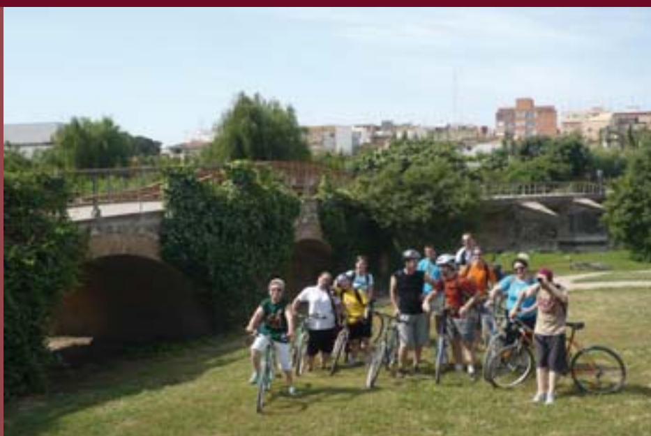
Participants en la Ruta de l'Aigua.

Joves de Quart de Poblet i altres municipis de la comarca, com Xirivella, Alfafar o Alaquàs han participat en una Ruta de l'Aigua per les riberes i l'àmbit d'influència del Túria. El recorregut es va realitzar amb bicicleta per a visitar i conèixer des de la cisterna àrab de Quart de Poblet fins a l'Assut del Repartiment, el parc fluvial del Túria, les séquies de Mestalla, Mislata i Tormos o el Molí de Testar.