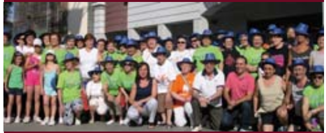
El jueves 25 de junio los grupos de gimnasia de mantenimiento de personas mayores disfrutaron de la tradicional salida a la naturaleza. La alcaldesa Carmen Martínez les da la bienvenida al inicio de la actividad.