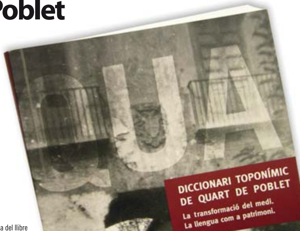
Portada del llibre

La regidora de Cultura, Mercedes Zuriaga, va agrair la seua dedicació a la defensa i la preservació del patrimoni històric, cultural i popular de Quart de Poblet.