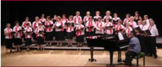
Actuación de la Coral Rondó de Quart de Poblet.