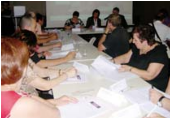
Portal de las Asociaciones de Quart de Poblet

25 asociaciones de Quart de Poblet han firmado el convenio de adhesión a la plataforma digital de entidades locales, impulsada por el Ayuntamiento y el Consejo Local de Participación Ciudadana. Esta plataforma permitirá a las entidades tener una presencia activa en Internet, optimizar sus recursos, llegar a más ciudadanos y ciudadanas y coordinarse. El proyecto contempla formar a las asociaciones para que puedan construir su propia web e integrarla en el portal http://associacions.quartdepoblet.org . El municipio cuenta con 137 asociaciones censadas.