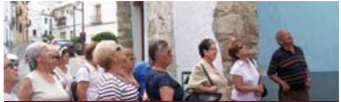
Salida cultural a Puerto de Sagunto-Ciudad Factoría.