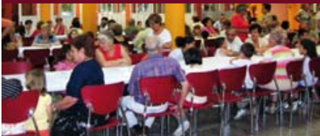
Abuelos y abuelas comparten con sus nietos y nietas una merienda con animación.