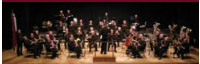
Actuación de la Banda de Música "Els Majors de l'Horta Sud".