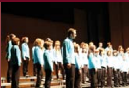
I Encuentro Mundial de Coros

En el Auditori Molí de Vila se dieron cita los coros “Gaudeamus Korala” de Gernika (País Vasco), “Coro Infantil UENSA” de Isla Margarita (Venezuela) y Coral Virelai de la Escola Coral de Quart de Poblet.