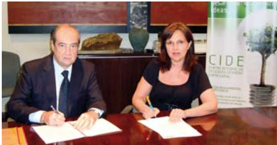
L'alcaldesa de Quart de Poblet i el director general del Centre Europeu d'Empreses Innovadores de València firmen el conveni.