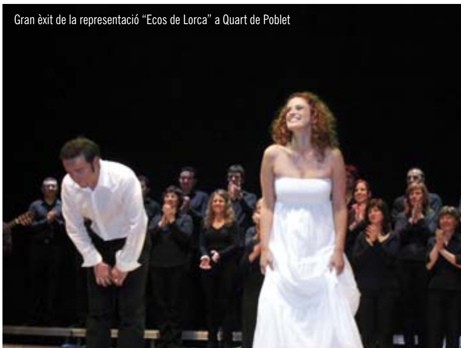
Gran èxit de la representació "Ecos de Lorca" a Quart de Poblet

A més a més, l'any que ve celebrarà el 35 aniversari i ja estan preparant possibles intercanvis amb altres formacions musicals dels Estats Units i concerts de música brasilera.