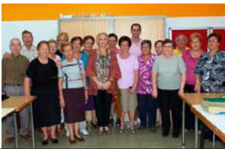
Taller de Memoria.