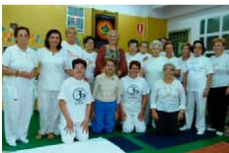
Taller de Yoga.