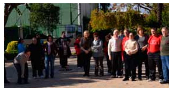
Jornada esportiva de centres ocupacionals.