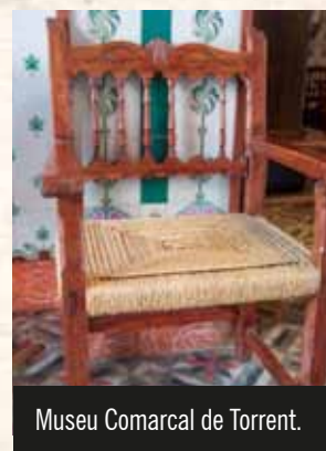
Museu Comarcal de Torrent.