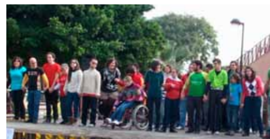
Jornada lúdicoesportiva d'Afaco.