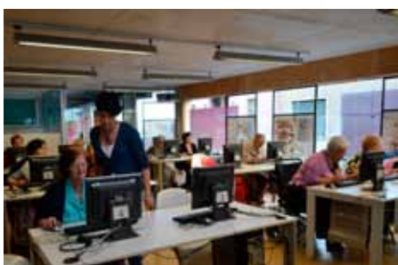
Salida cultural a Almansa.