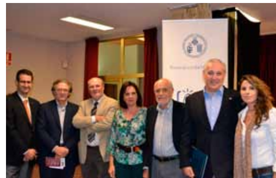
Membres de la taula rodona.