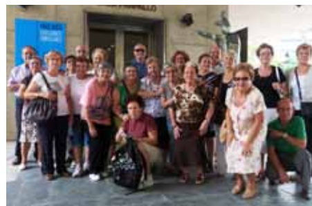
Salida cultural en el Día del Alzheimer.