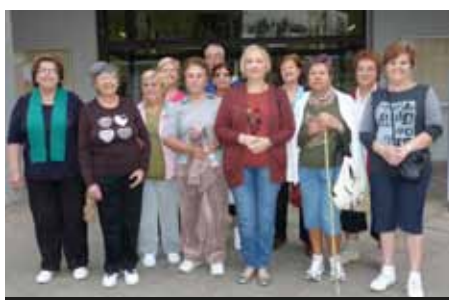
Taller de paseos saludables.