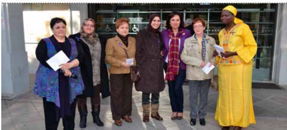
Les dones que van llegir el poema de Benedetti.