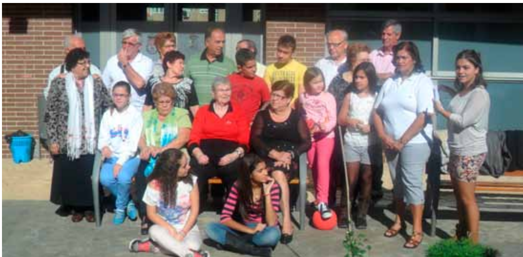
Participantes en el rodaje.