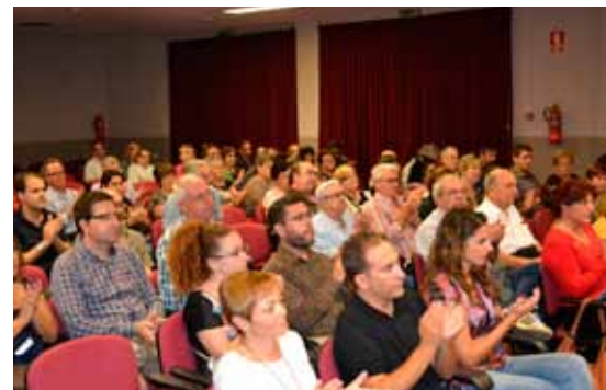
Públic assistent a la presentació.