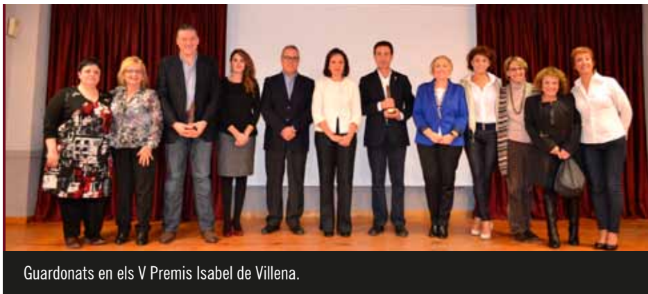
Guardonats en els V Premis Isabel de Villena.