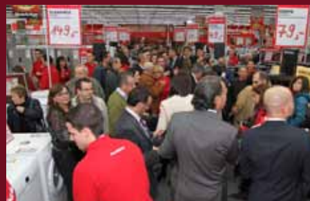
La apertura fue un éxito.

sejar a nuestros clientes en la búsqueda de su producto ideal" .