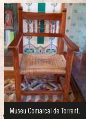
Museu Comarcal de Torrent.