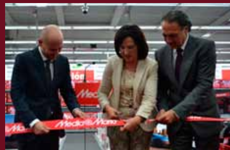
La alcaldesa corta la cinta inaugural.