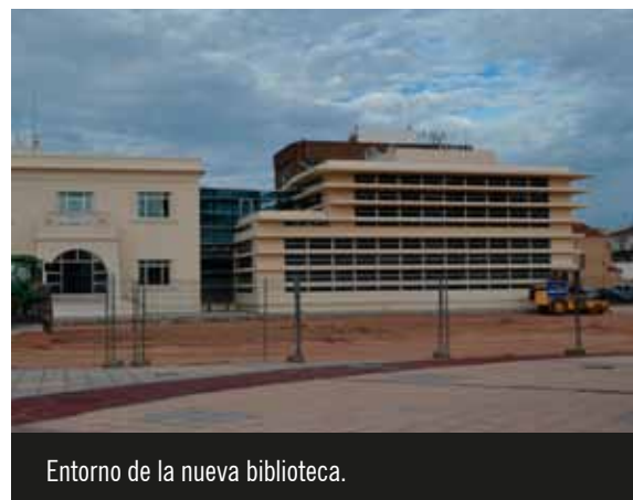
Entorno de la nueva biblioteca.

Por otra parte, se ha iniciado la urbanización provisional del entorno de la nueva Biblioteca Pública Municipal. Se trata de una actuación que persigue mantener la zona limpia, accesible y con servicios para la ciudadanía, a la espera de que tanto la