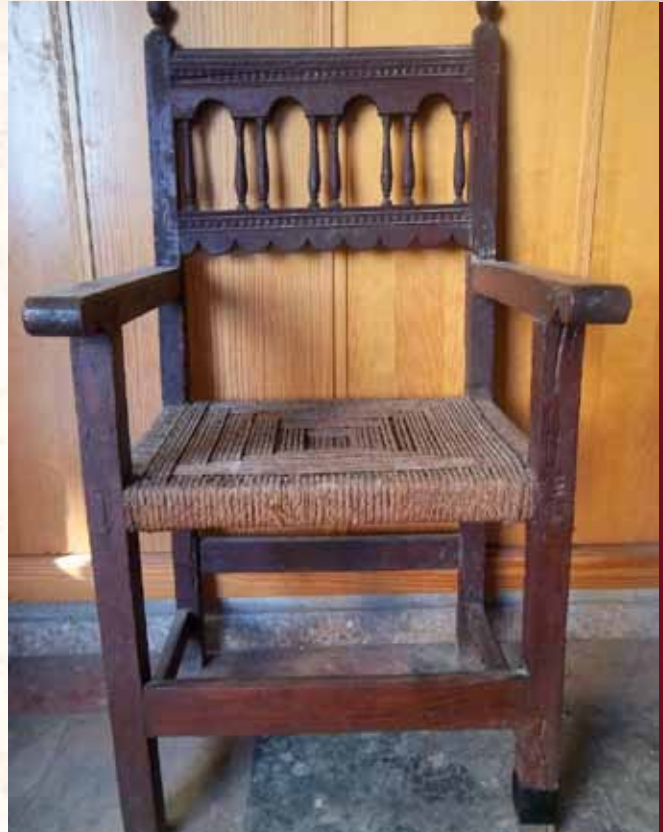
Cadira de repòs trobada a Quart de Poblet.

Hem trobat peces com aquesta en diferents llocs com el Museu de Lluçena del Cid a Castelló, la Masía de las Estrellas de Catarroja, que en tenen dos i també al Museu Comarcal de Torrent, on també hi ha de dos classes. Però cap d'elles té la categoria i singularitat de la que s'ha trobat al contenidor de Quart. Aquesta situació ens arrossega a reflexionar sobre els materials que llancem, sobre la consideració que en tenim del nostre patrimoni més domèstic i obri de nou el debat sobre la necessitat de trobar un