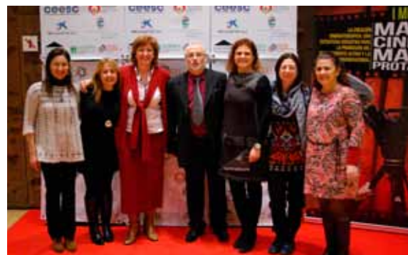
Presentación en la muestra de San Fernando de Henares.

desde distintos ámbitos, empezando por las áreas de Educación, Tercera Edad, Bienestar Social -Familia, Cultura y Juventud, Menores, SEAFI, Inserción Socio-laboral, Igualdad, Deportes, Biblioteca Intermunicipal... y continuando por el Centro de Día de Mayores, los centros educativos -Escuela Infantil, centros públicos de Educación Infantil y Primaria, Instituto de Educación Secundaria, Escuela de Adultos- y Centro de Salud, entre otros organismos y servicios.