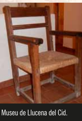
Museu de Lluçena del Cid.