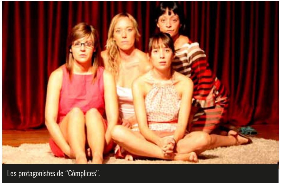
Les protagonistes de “Còmplices”.