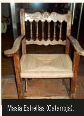
Masía Estrellas (Catarroja).