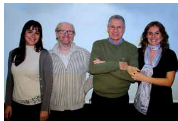
Los organizadores de la 1ª Semana de la Ciencia.

Todavía estamos trabajando en ello, pero podemos decir, sin caer en la autoalabanza, que la 1ª Semana de la Ciencia fue un éxito mayor del que nosotros mismos esperábamos. Ciertamente presentamos mucha variedad de