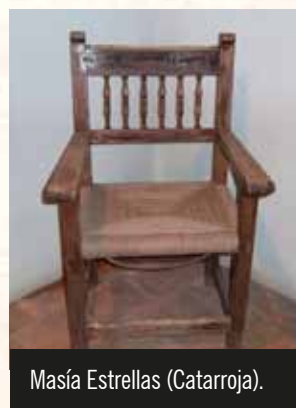
Masía Estrellas (Catarroja).