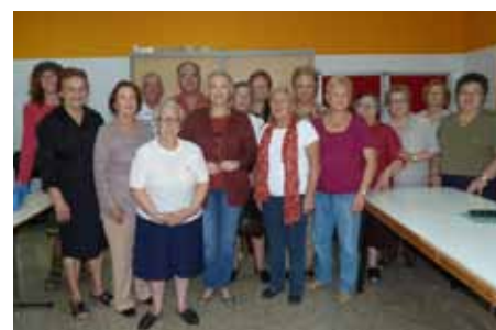
Taller de Crecimiento Personal.