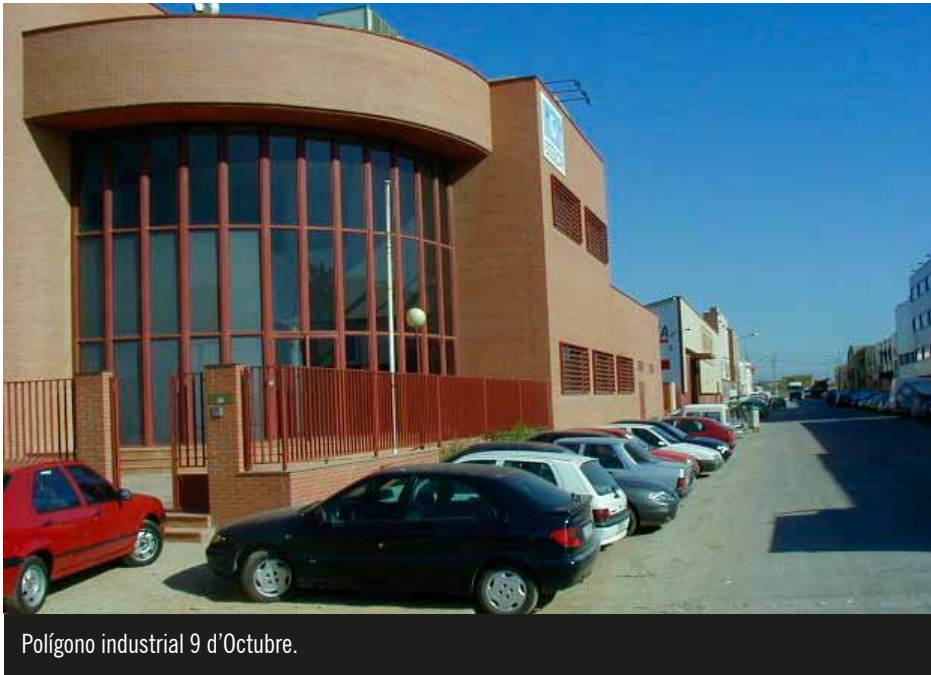
Polígono industrial 9 d'Octubre.

El pleno del Ayuntamiento de Quart de Poblet aprobó las ordenanzas fiscales y demás ingresos de derecho público para 2013, entre las que destaca la exención del pago del Impuesto sobre