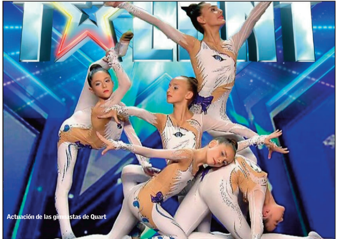
Actuación de las gimnastas de Quart

Porque fue el programa el que se interesó por el trabajo del Club y las cinco valientes, junto a sus preparadoras y con el apoyo inestimable de sus familias (sus madres saben de las horas que dedicaron a preparar los maillots, llenos de cristales que las ayudaran a brillar), las que dijeron que sí a esta aventura. Tenían que presentar algo diferente y optaron por centrar la coreografía sobre una tarima y, en un espacio muy reducido, hacer gala de una gran coordinación, flexibilidad y equilibrio con brazos, algo a lo que no están habituadas y que,