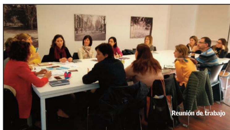
Reunión de trabajo

Precisamente estos tres psicólogos municipales han iniciado un trabajo de coordinación para colaborar en iniciativas dentro de la intervención comunitaria que permitan poder atender a mayor número de población a través de talleres y charlas informativas, como la que se celebrará el 29 de mayo.