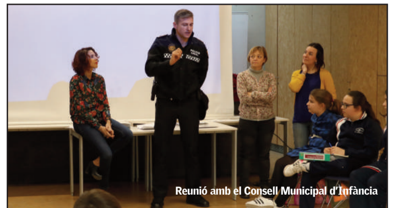
Reunió amb el Consell Municipal d'Infància

El Consell Municipal d'Infància del nostre municipi valorarà després de la reunió si hi ha alguna actuació que consideren que no s'està realitzant i seria necessària, o què podrien aportar elles i ells, assu-