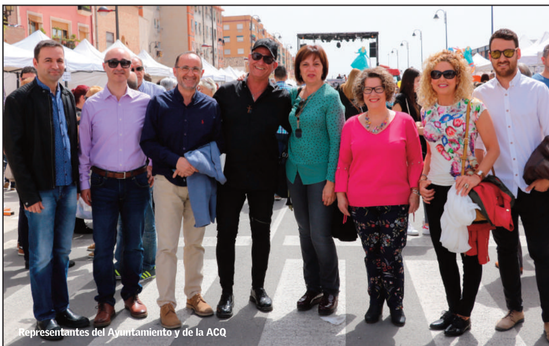
Representantes del Ayuntamiento y de la ACQ

Tras la pasarela, se programó una Gran Fiesta Disco Móvil y ya desde la tarde las personas asistentes pudieron degustar las mejores tapas en la zona de restauración, que siguió con un llenazo absoluto el domingo.