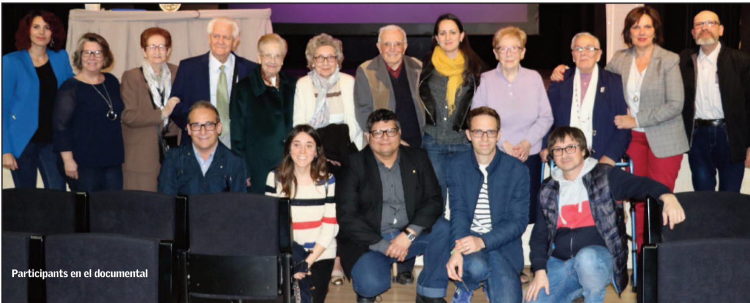
Participants en el documental