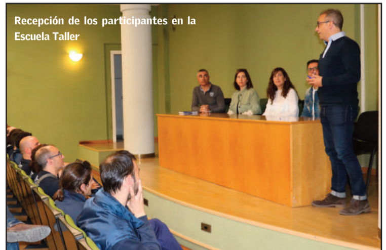
Recepción de los participantes en la Escuela Taller

Otros 15 jóvenes de Quart de Poblet han iniciado su beca en el marco del Programa Operativo de Empleo Joven-POEJ "Més Opcions Quart", gestionado por la Di-