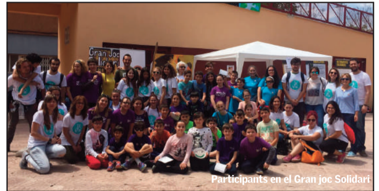
Participants en el Gran joc Solidari

Es objetivo de esta multinacional contribuir de una forma positiva al desarrollo económico y social de aquellas comunidades en las que desempeña su actividad, proporcionando empleo y respondiendo a las necesidades sociales, bien directamente o bien en colaboración con Smurfit Kappa Foundation (entidad sin ánimo de lucro del grupo Smurfit Kappa dedicada a dar apoyo económico a proyectos sociales en los lugares donde el grupo desarrolla sus actividades). De ahí su voluntad de ser parte esencial de este proyecto de apoyo a la Infancia y la Juventud.