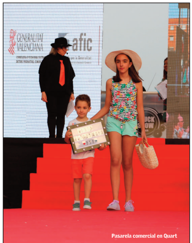
Pasarela comercial en Quart