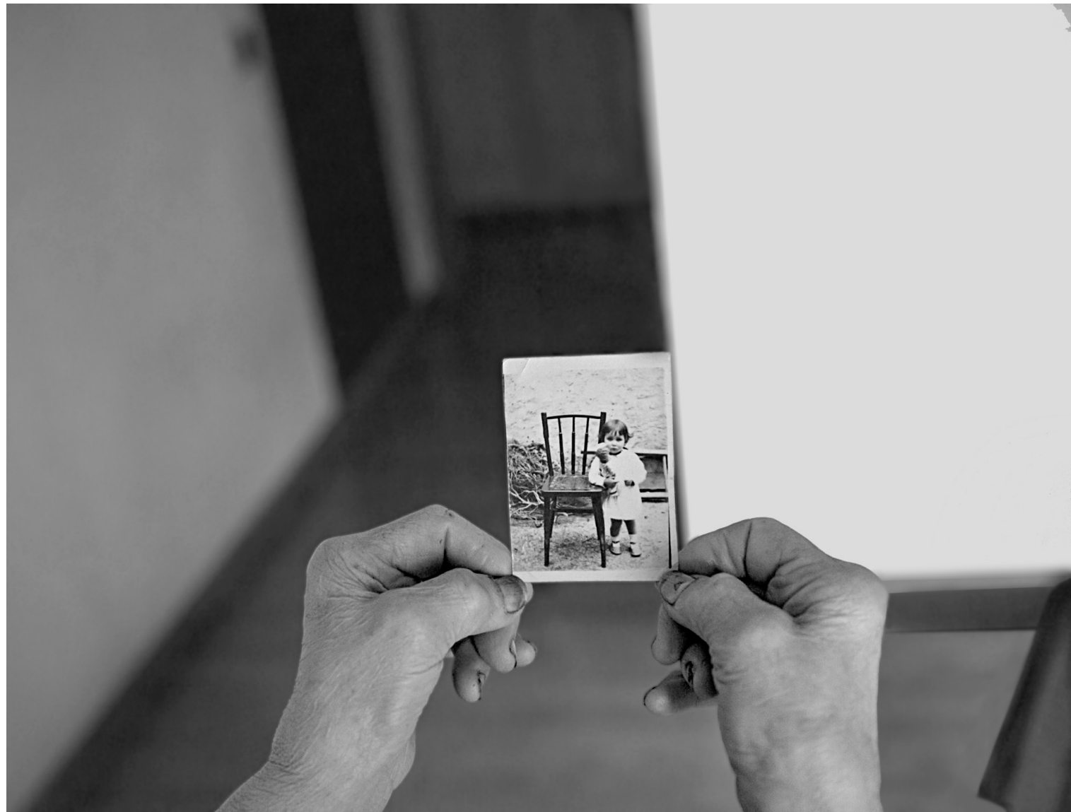
CARINA BALFEGÓ MORALES Nostalgia II 20 x 26,3 cm.