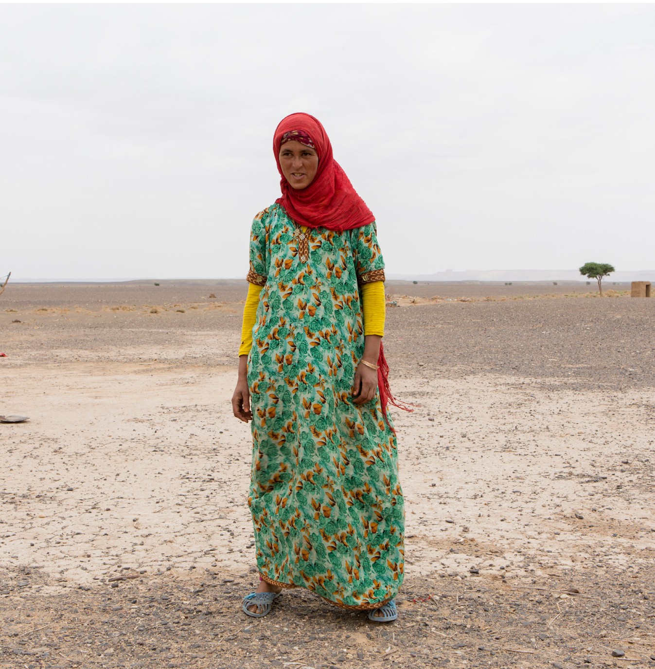
XAVIER FERRER CHUST Nómadas II 18 x 18 cm.