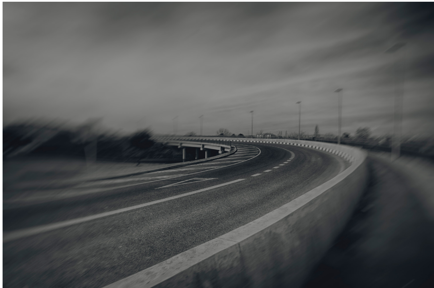
TOMÁS ORTIZ ARCE Curva Nord