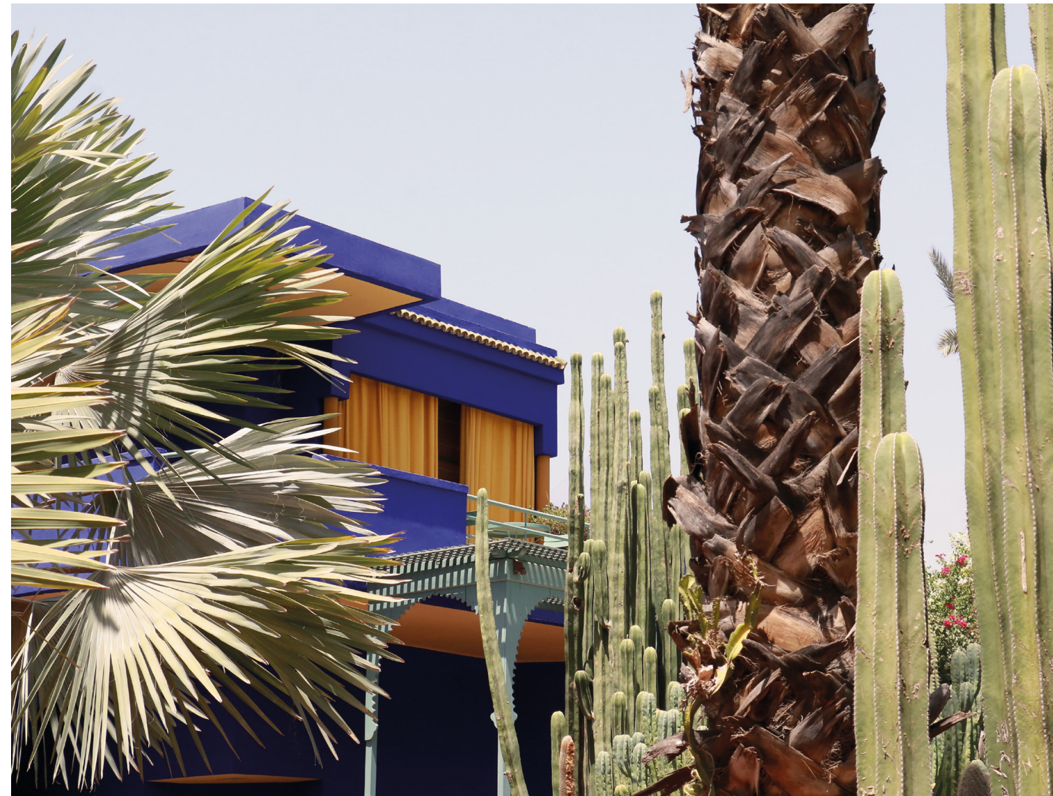
JAVIER CIVERA PEÑARROCHA Marruecos; contrastes y colores I 29,3 x 39,5 cm.