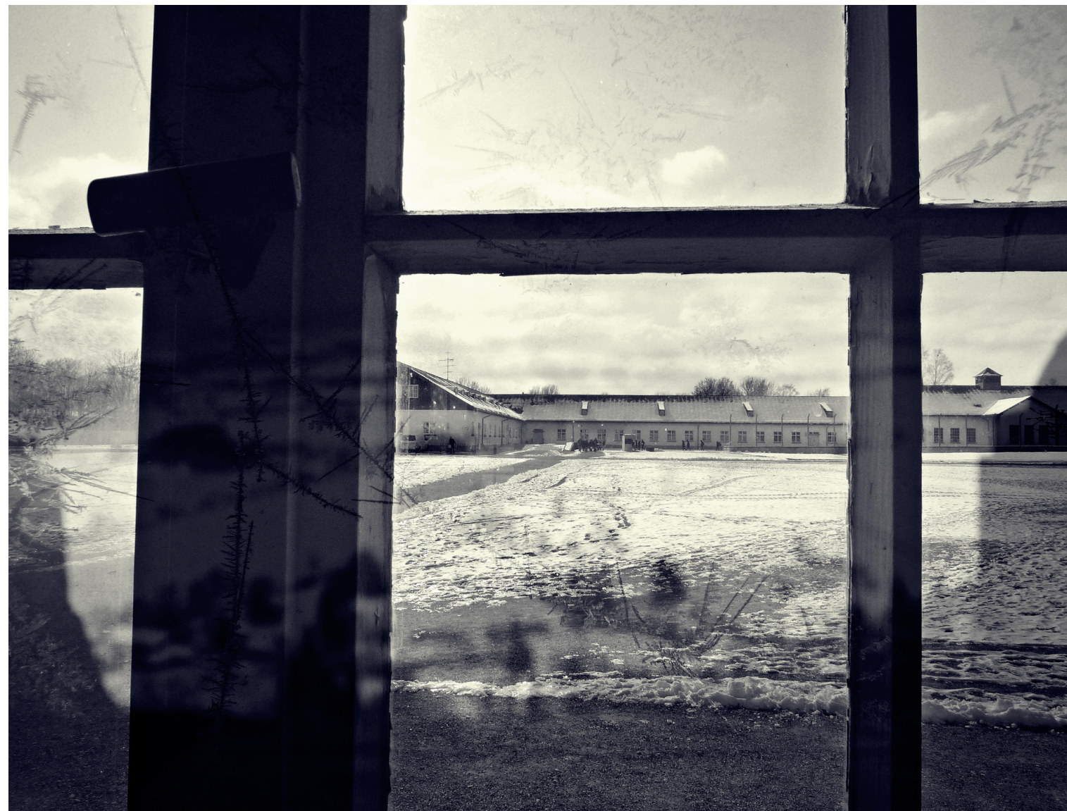
SILVIA JUÁREZ ÁLVAREZ Muerte I 25 x 35,5 cm.