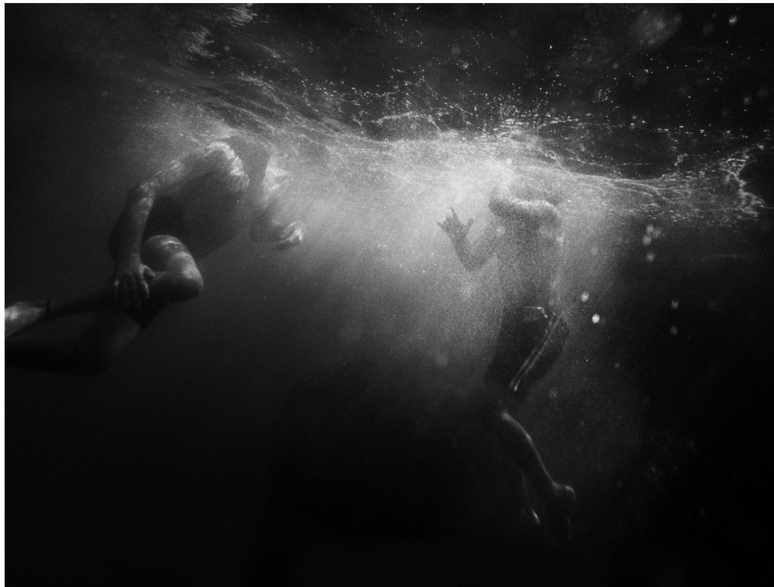
LOURDES NAVARRO ORTIZ Underwater III 20,5 x 27,5 cm.