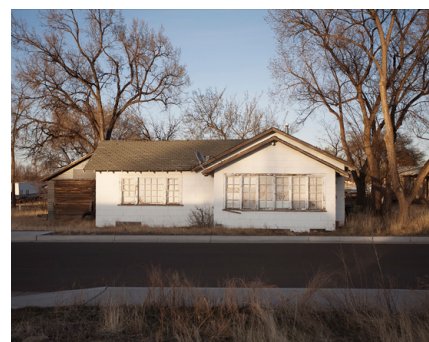
CARLOS BRAVO PAREDES COL·LECCIÓ West 11,3 x 15 cm.