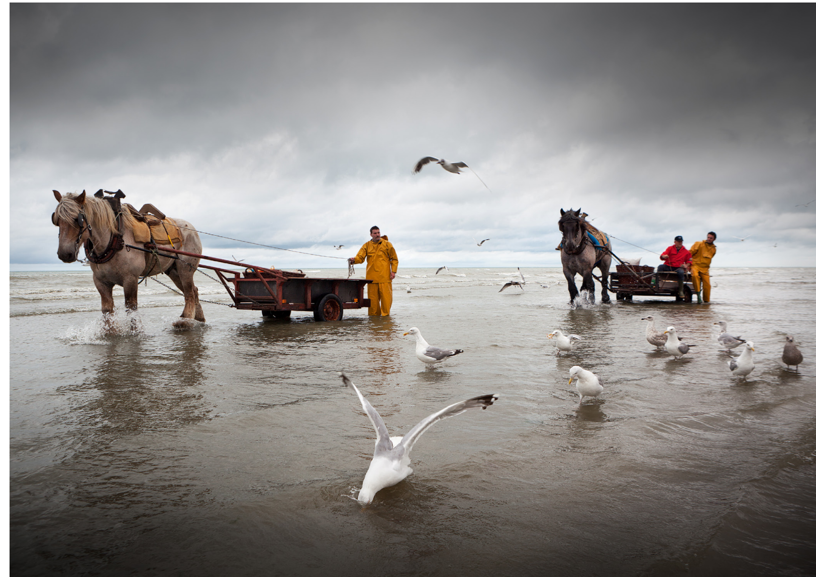
MIQUEL PLANELLS SAURINA Pesca con caballos III 20 x 29,5 cm.