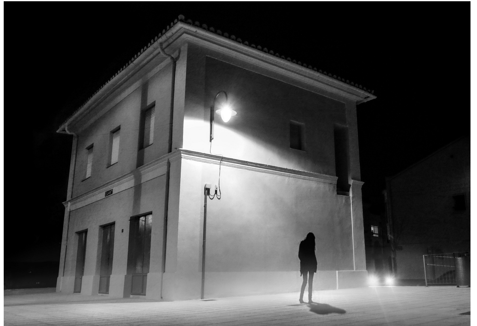
SERGE CORNILLET Llum de nit