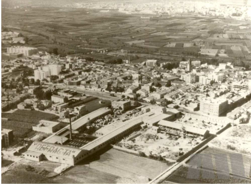
4. Foto histórica de Quart de Poblet