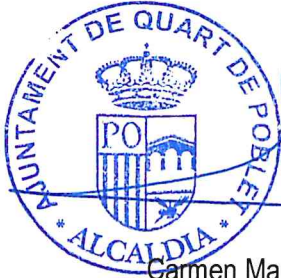
Garmen Martínez Ramírez Alcaldesa de l'Ajuntament de Quart de Poblet

En prova de conformitat, les parts subscriuen el present conveni, per triplicat exemplar, al lloc i en la data baix esmentats.